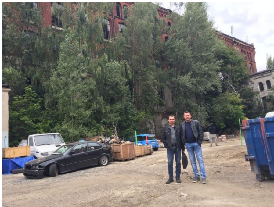
Hala w tle – miejsce produkcji i montażu S03

Jak zwykle przy takiej okazji pozwoliliśmy sobie na mały spacer po miejscach historycznych zakładu.