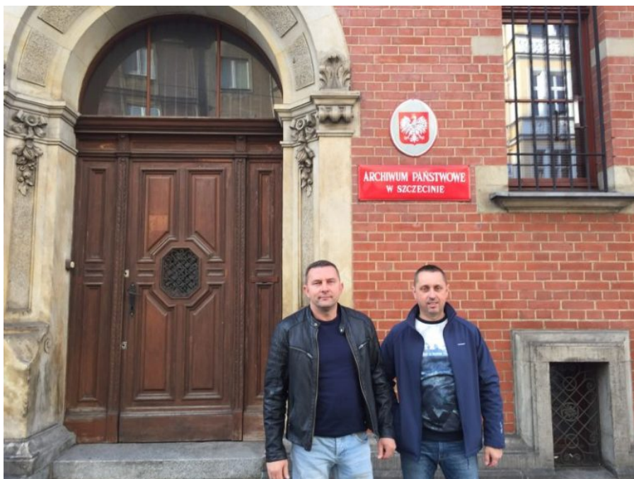
Przed wejściem na spotkanie

Mając już zgodę Polmo, umówiliśmy się na wizytę w Archiwum Państwowym w Szczecinie. Jadąc 18.10.2019 na spotkanie, każdy z nas był mocno przejęty, i wszyscy zadawaliśmy sobie pytanie czy w ogóle ten nasz pomysł jest możliwy do realizacji?