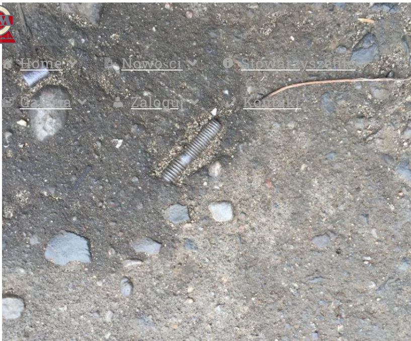
Czyżby szpilka do silnika S03?

Podsumowując, to był naprawdę fajny i owocny dzień.