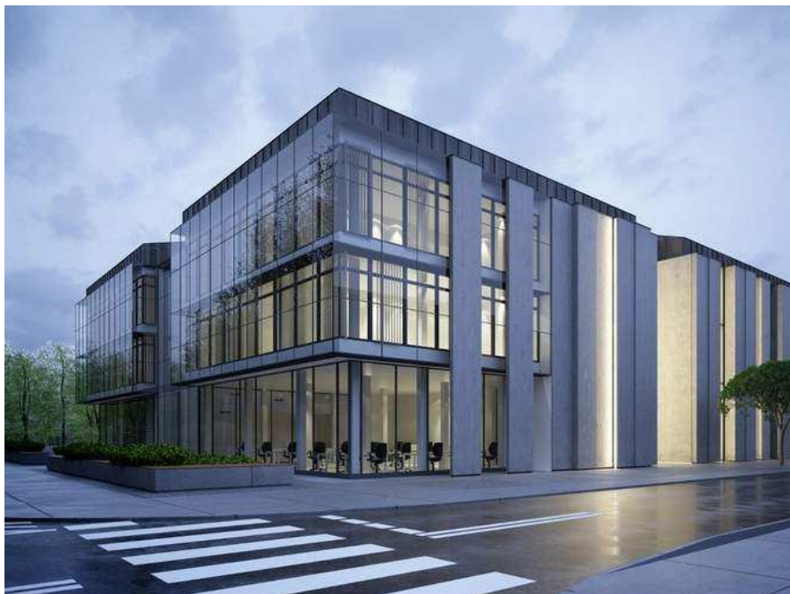
fot. Wizualizacja IDS Architekci

Wizualizacja budynku jest nowoczesna i lekka. Doskonale wypełni prestiżową lokalizację, odświeżając przestrzeń naszego miasta.