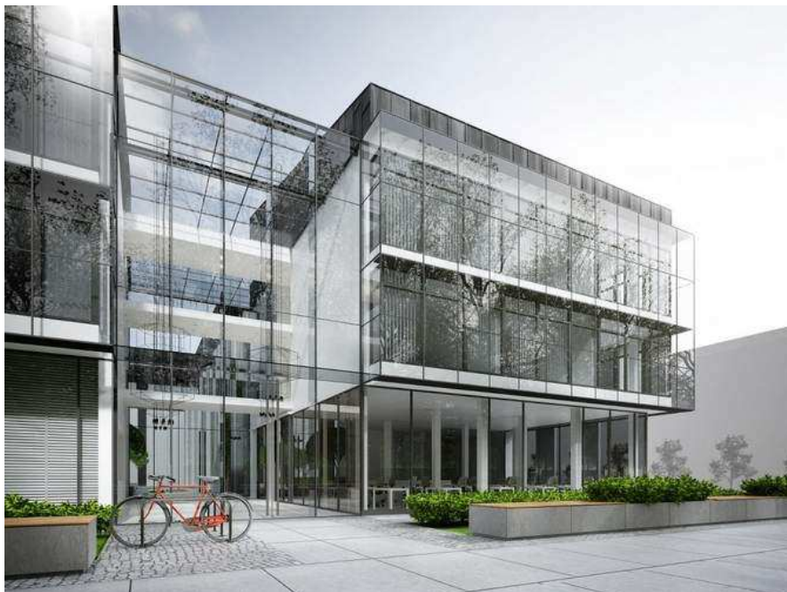
fot. Wizualizacja IDS Architekci

Zaplanowanie obiektu w tak ważnym dla szczecinian miejscu , jakim są Jasne Błonia, było dużym wyzwaniem. Znaczną część budynku stanowi magazyn.