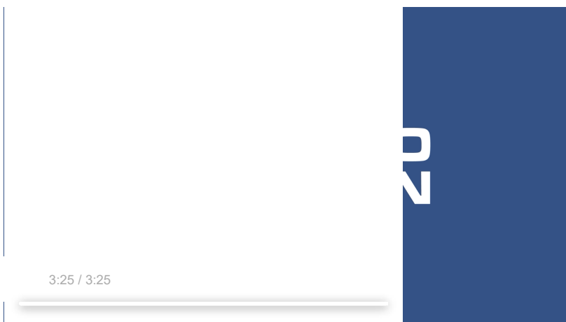
Realizacja Maciej Papke [Radio Szczecin]

REGION | 2023-04-30 08:30 | GRZEGORZ GIBAS