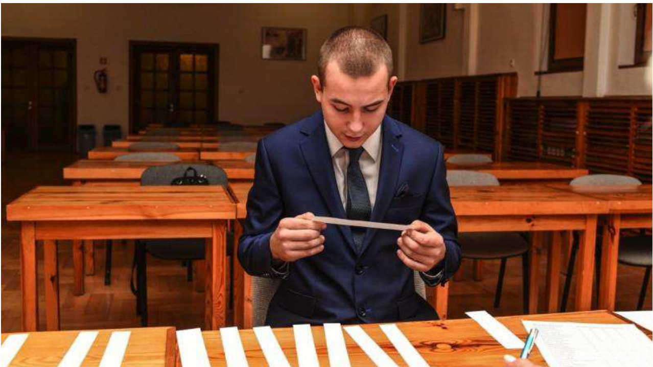
Konkurs "Polskie drogi do niepodległości".